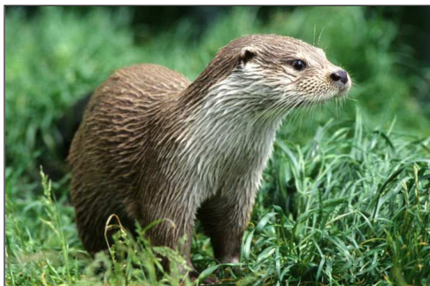
Odderen er nataktiv, men efterlader spor i vandkanten

Der er et rigt fugle- og dyreliv omkring Flyndersø. Er du heldig, kan du se fiskeørnen jage over søen, et firben, som soler sig eller rådyr på jagt efter føde. Måske støder du også på spor efter oddere.