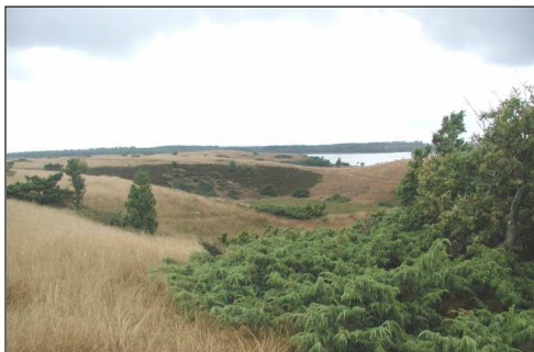
Dødis-hul ved Brejnskov Bro

Langs skrænterne snor ådalstien sig 3,5 kilometer rundt om Stubber Å. Turen bringer dig over mose og overdrev, langs de vidtstrakte hede arealer og gennem det gamle egekrat med de krogede egetræer. Fra udsigtspunkter ses Flyndersø der strækker sig over 8 km mod nord, hvor den løber ud i Karup Å.