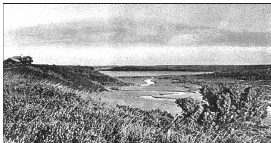
Historisk foto. Stubber Å med Flyndersø i baggrunden

Upåvirket af menneskehånd flyder Stubber Å naturligt gennem engene og moserne i ådalen. Egekrattet, der breder sig på skrænterne, er rester af den oprindelige danske urskov. Trods ihærdige forsøg på at afvande Flyndersø i 1871, fremtræder søen som den har set ud siden den blev dannet i slutningen af istiden.